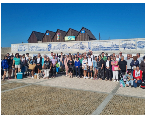
DIA DE PRAIA