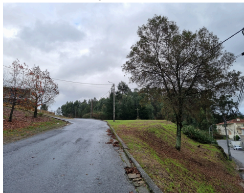
RUA DO CRUZEIRO LUMINÁRIAS - EM EXECUÇÃO