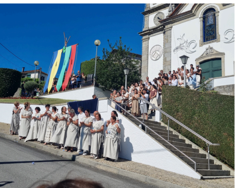
PEÇA TEATRAL - SENHORA DO SOL