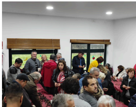
MAGUSTO DE 2022