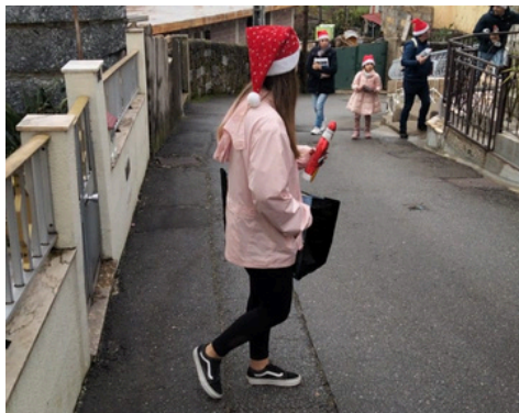
NATAL DE 2022 - ENTREGA DE PAI NATAL