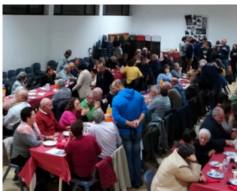
CEIA DE NATAL 2022