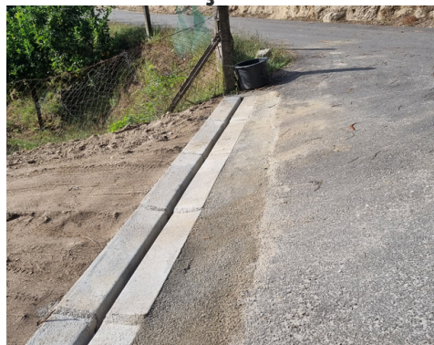
RUA DO PENEDO DO BICHO - CANELETES DE BETÃO