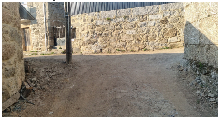
RUA DO PAÇO ALARGAMENTO E PAVIMENTAÇÃO