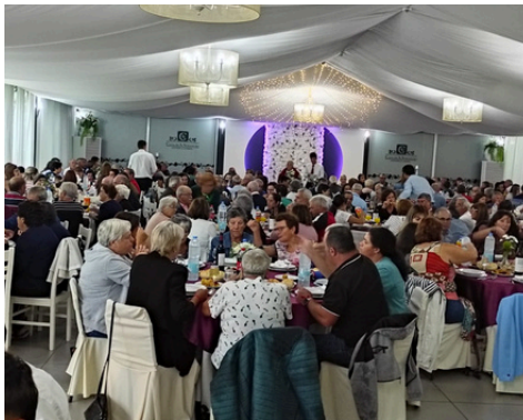
PASSEIO ANUAL DA UNIÃO DE FREGUESIAS