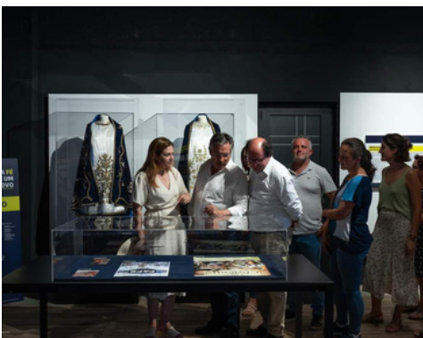
EXPOSIÇÃO SENHORA DA MISERICÓRDIA, EM ANTIME