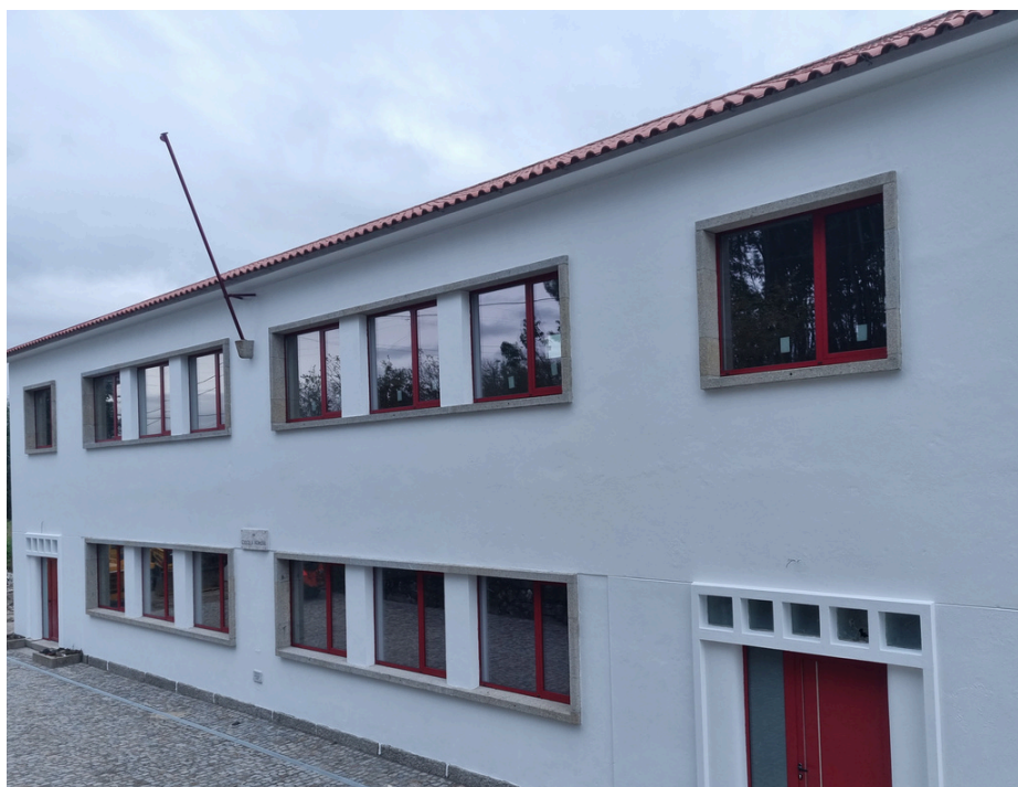
REQUALIFICAÇÃO DA ESCOLA DA CARIOCA