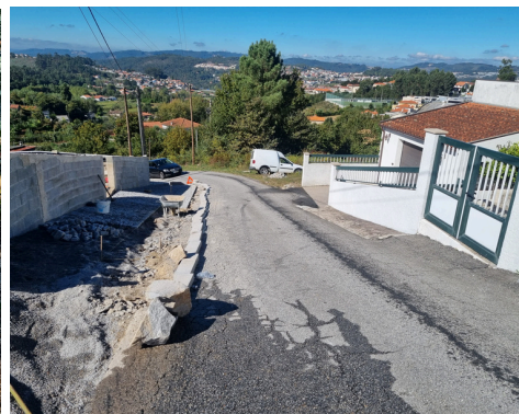
RUA DAS COUTADAS E RUA DO FOLGOSO - REDE DE ABASTECIMENTO DE ÁGUA E DE ÁGUAS PLUVIAIS. (BREVEMENTE)