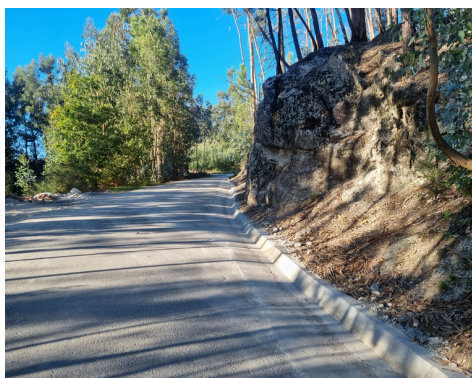
RUA DA COSTA - CONSTRUÇÃO DE 270 METROS DE VALETAS