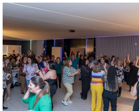
DIA INTERNACIONAL DA MULHER