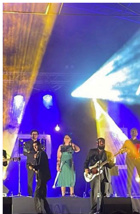
ANTIME FOI INCLUIDO NAS FESTAS DO CONCELHO