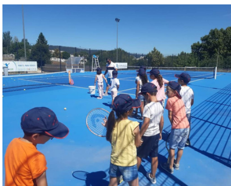
CAF - COMPONENTE DE APOIO À FAMÍLIA