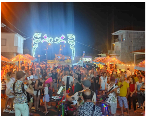
FESTAS DO CONCELHO EM ANTIME (TRASTES)