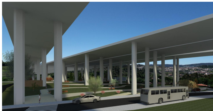
PARQUE DE LAZER, GERIÁTRICO E INFANTIL DA UNIÃO DE FREGUESIAS - A INICIAR EM 2024