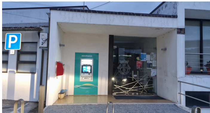
CONSTRUÇÃO E INSTALAÇÃO DE CAIXA MULTIBANCO