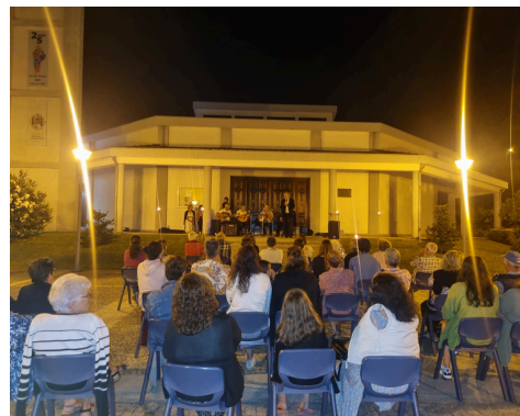
FADOS: GUITARRAS DE ST.º ESTEVÃO