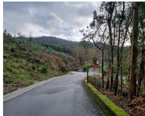
RUA DA COSTA AMPLIAÇÃO - EM EXECUÇÃO