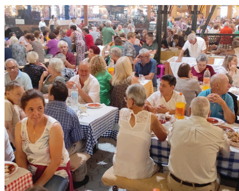
DIA DO IDOSO - QUINTA DA MALAFAIA