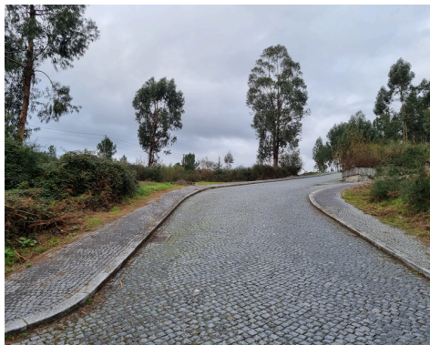
TRAVESSA DO CRUZEIRO AMPLIAÇÃO - EM EXECUÇÃO