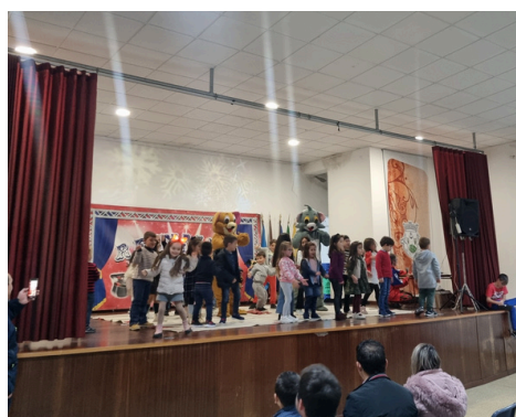
O MUNDO DA FANTASIA