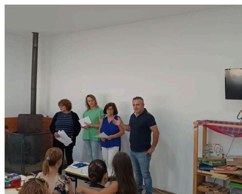
RECEÇÃO AOS ALUNOS

ESCOLA BÁSICA DE S. CLEMENTE E PRÉ-ESCOLAR - Foi aberto neste ano letivo o pré-escolar na escola de S. Clemente. Continuamos a apoiar a escola básica da união de freguesias, com transporte e lanches gratuitos, material escolar, visitas de estudo, CAF e em todas as iniciativas e festividades, mesmo com o aumento significativo do n.º de alunos.