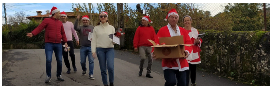
O PAI NATAL VOLTOU!