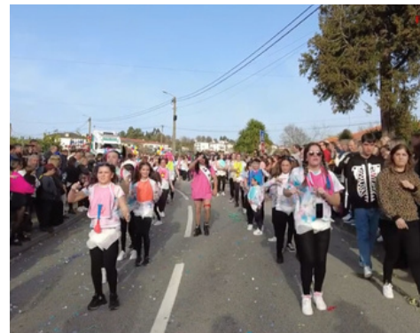
CARNAVAL DE ANTIME DE 2023 - O MELHOR CARNAVAL DE FAFE