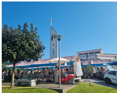
FEIRINHAS NAS FREGUESIAS