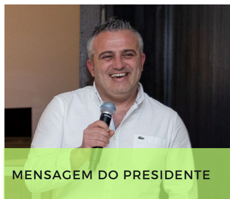
MENSAGEM DO PRESIDENTE