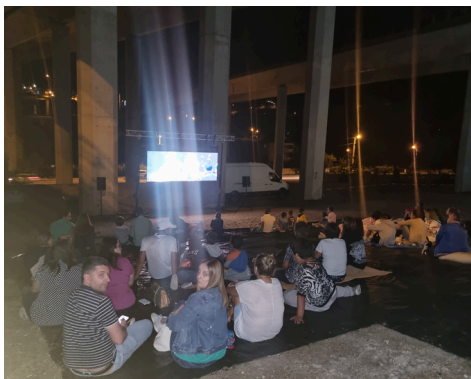
CINEMA AO AR LIVRE