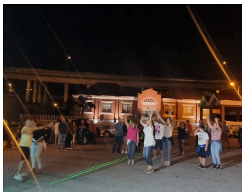
ARTISTA: FILIPE CARVALHAIS