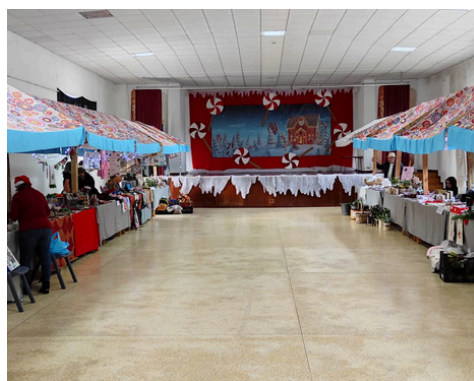
FEIRINHA DE NATAL 2022