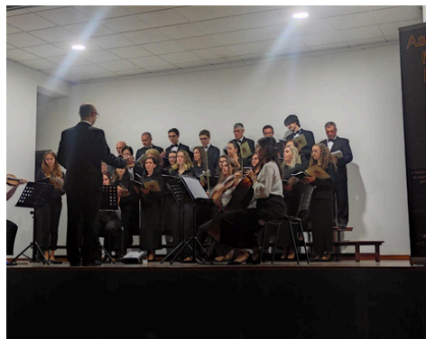
FESTIVAL DE MÚSICA POR FAFE - FANF'ART